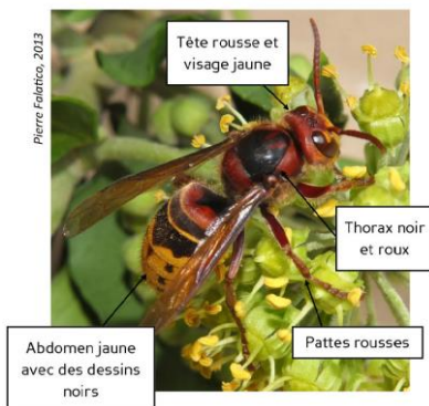
FRELON EUROPEEN VESPA CRABRO